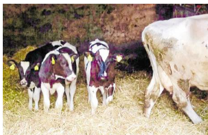
Bis sie acht Monate alt sind, nennt der Bauer alle jungen Rinder Kälber.