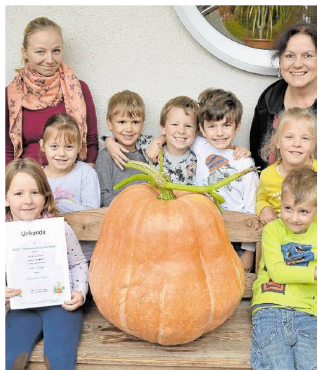
Beim letzten Kürbiswettbewerb kamen die Sieger aus Unna und Bergkamen.